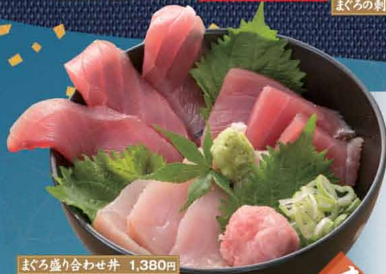
まぐろ盛り合わせ丼 1,380円