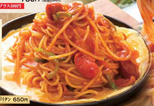
鉄板ナポリタン 650円