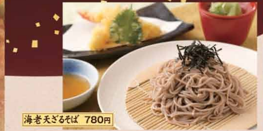
海老天ざるそば 780円