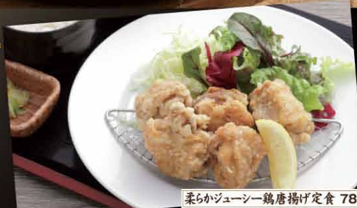
柔らかジュシー鶏唐揚げ定食 780円