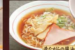
昔ながらの醤油ラーメン 520円