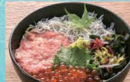
いくら・ネギトロ・しらすの三種丼 1,080円