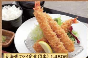
大海老フライ定食(3本) 1,480円