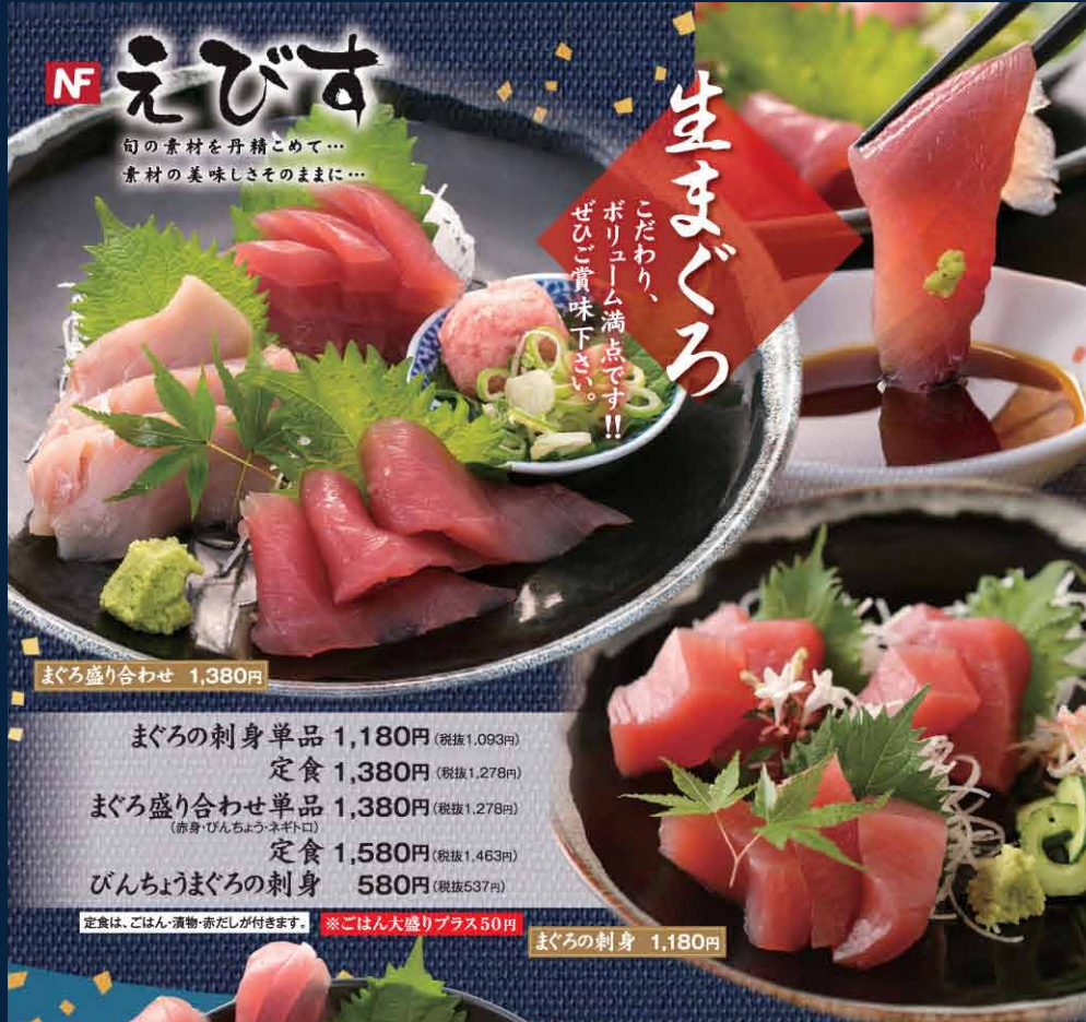
まぐろ盛り合わせ 1,380円