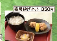
鶏唐揚げセット 350円