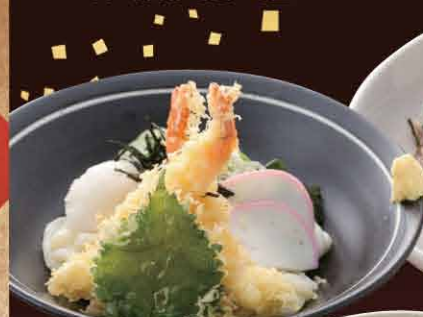
海老天ころおろしうどん 850円