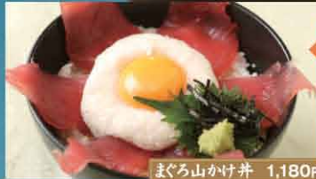
まぐろ山かけ丼 1,180円