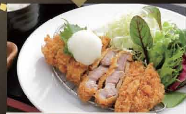
ローズカツ定食(みぞれポン酢) 850円

生姜焼き定食(ごはん・漬物・赤出し) 900円 (税抜833円) サクサク海老天ぷら定食(ごはん・漬物・赤出し) 800円 (税抜741円) 柔らかジュシー鶏唐揚げ定食(ごはん・漬物・赤出し) 780円 (税抜722円) ローズかつ定食(ソース) 850円 (税抜787円) (みぞれポン酢) 850円 (税抜787円) 大きなアジフライ定食 880円 (税抜815円) 醤油ラーメン定食(鶏唐揚げ2個・ごはん・漬物) 820円 (税抜759円)