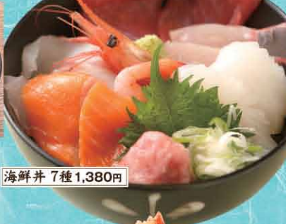
海鮮丼 7種 1,380円