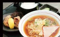
醤油ラーメン定食 820円

※そば・大豆・小麦・卵を使用した食品がございます。アレルギーがある方はご注意ください。