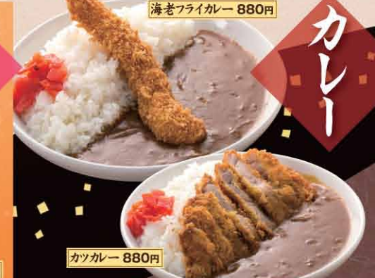
海老フライカレー 880円

お子様セット(おもちゃ付) ¥580 (税抜537円) お子様カレー(おもちゃ付) ¥500 (税抜463円) ミニうどん・そば・きしめん(温・冷) ¥280 (税抜259円)