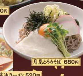
月見とろろそば 680円