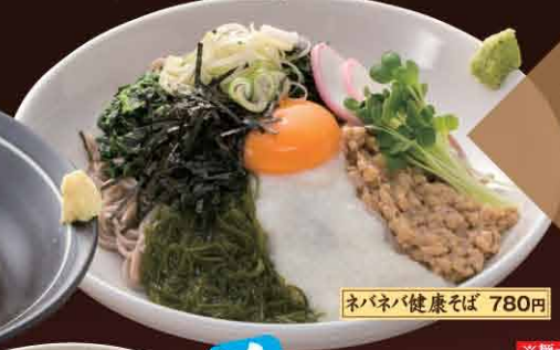
ネバネバ健康そば 780円