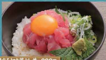
まぐろ切り落とし丼 880円