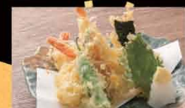
サクサク海老天ぷら定食 800円